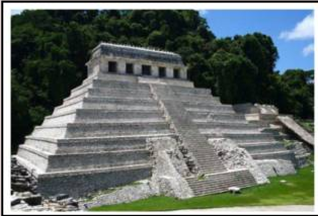
На фото: "Храм надписей" в Паленке

Скульптура и живопись гармонично дополняли архитектуру майя. Основные темы изображений - божества, правители, быт. Алтари и стелы украшались многофигурными композициями, сочетающими различные скульптурные жанры: резьбу, барельеф, горельеф, круглый и моделированный объем. Из материала использовались обсидиан, кремьень, нефрит, раковины, кость и дерево.