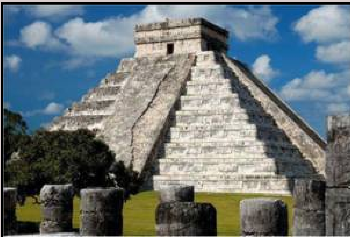
На фото: Древний город майя Чичен–Ица

Жилые дома майя строились на низких платформах с небольшим огороженным участком земли, который включал семейное кладбище. Обычно эти участки земли были разграничены низким забором, сложенным из камней. Участок земли каждого семейства включал в себя: хижину, колодец, уборную, детскую, сад и хозяйственную комнату с простой тростниковой крышей.