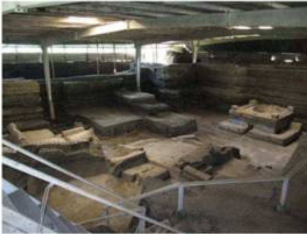
На фото: Руины Хойя-де-Серен

К типу церемониальных построек относились пирамиды, на вершинах которых располагались храмы. Они были квадратными, тесными, украшались надписями, орнаментом и выполняли роль святилищ. Образцом архитектуры такого типа является "Храм надписей" в Паленке. Здания у майя строились через определенные промежутки времени - 5, 20 и 50 лет. Майя каждые 52 года заново облицовывали свои пирамиды и каждые 5 лет воздвигали алтари.