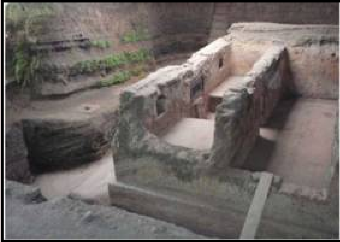
На фото: Руины Хойя–де–Серен

Майя жили самостоятельными и независимыми родами. Каждый из них образовал город-государство, также независимое, с прилегающими землями и городками. Во главе их стоял правитель — "великий человек" с неограниченными правами и избиравшийся пожизненно. Древнейшими городами майя были Тикаль, Киригуа, Ица.